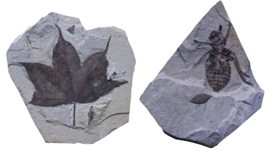
展示資料提供: 栃木県立博物館・木の葉化石園

第2会場(3F)開催30回記念特別展示 那須発! 化石大集合 ~ 30万年前の古代化石湖にタイムスリップ ~ 約30万年前の栃木県那須塩原市・塩原温泉郷にあった古代湖、塩原湖成層から採集された化石を一堂で紹介。 今回の展示では、塩原湖成層の縞状堆積構造がみられる剥き取り標本や太古の湖に生息していた植物、昆虫、クモ類、魚類、両生類、哺乳類などの門外不出の貴重な化石標本を展示、塩原産の化石の知られざる魅力に迫る。